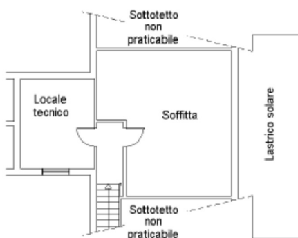
Piano primo sottotetto h med.=200

La classe energetica del villino è stata progettata in conformità all'articolo 28 della legge 10/1991 per il contenimento del consumo energetico degli edifici, come da progetto depositato presso il Comune di Roma. Prima della vendita dell'immobile andrà prodotto regolare l'Attestato di Prestazione Energetica (APE) che sarà redatto in base alle opere e agli impianti a completamento (caldaia, condizionatori, impianti fotovoltaici e solare termico, ecc.).